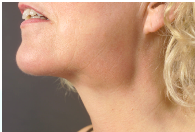
Afbeelding: Zwelling van de onderkaaksspeekselklier door een gezwel.

Een stevige, niet pijnlijke zwelling onder de kaak kan duiden op een gezwel in de speekselklier. Een gezwel in de onderkaaksspeekselklier kenmerkt zich door een bobbel onder de kaakrand, nabij de kaakhoek. In ongeveer 65 % van de gevallen is het een goedaardig gezwel. Kwaadaardige gezwellen van deze speekselklier komen dus voor, maar minder vaak dan goedaardige gezwellen.